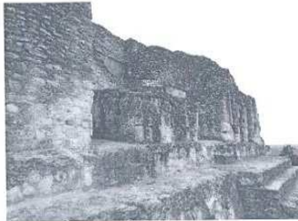
Foto 2. Sección superior del Edificio 216, Acrópolis Este