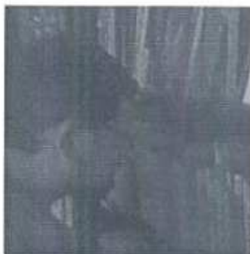
Foto 7. Como parte de la planificación se revisaron documentos e informes de trabajo