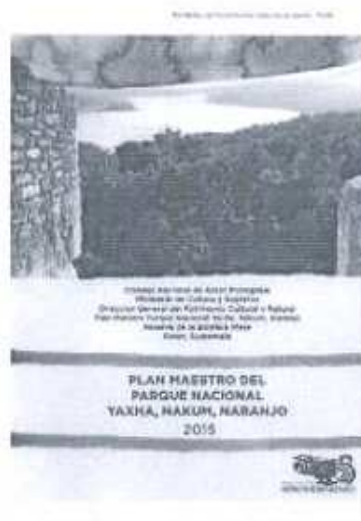
Foto 9. Carátula del Borrador del Plan Maestro del Parque