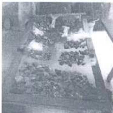
Foto 6. Muestras de cerámica recuperada de la investigación en el Edificio 137 durante su proceso de evaluación

los datos ya tomados durante los meses anteriores y se continúa con la evaluación de la muestra.