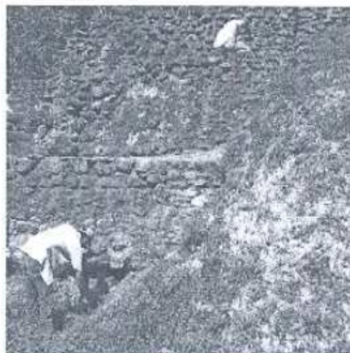
Foto 4. Trabajos de limpieza, Edificio 4, Grupo Maler