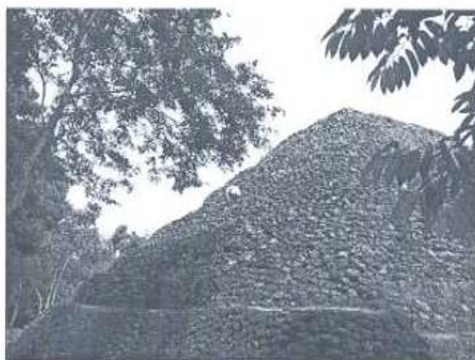
Foto 5. Edificio 152, lado este durante la realización de los trabajos