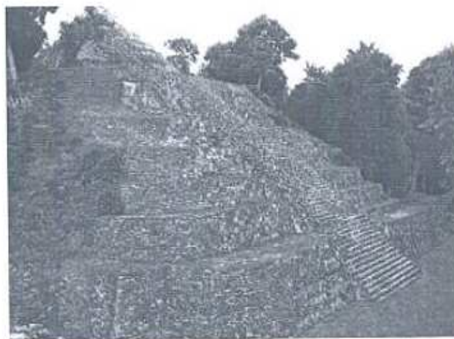
Foto 3. Edificio 142, Acrópolis Norte