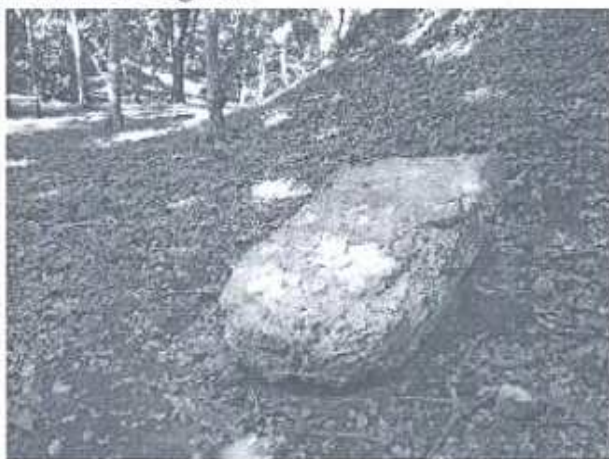
Foto 1. Estela ubicada en la Plaza D